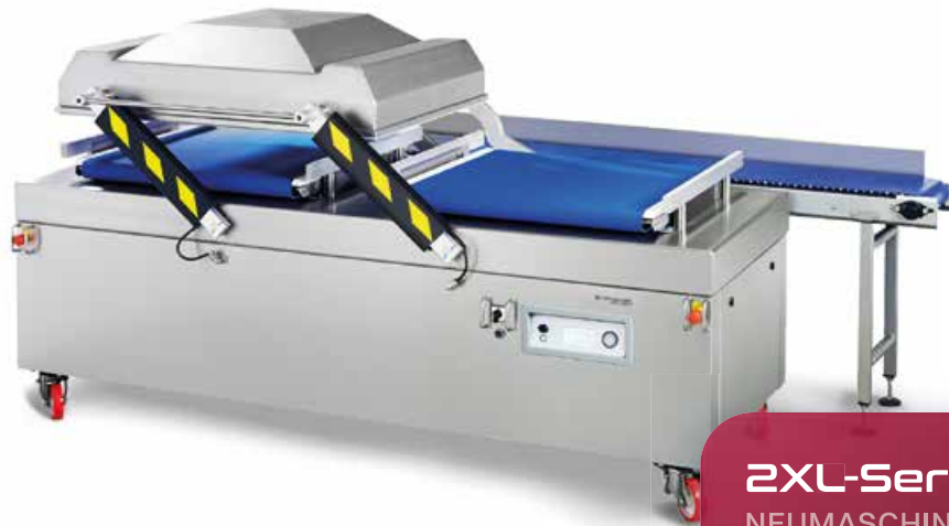
2XL-Serie NEUMASCHINEN - KAMMER