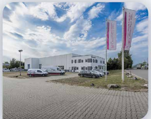
Der GPS Reisacher Firmenstandort in Bad Grönenbach

GPS Reisacher ist ein weltweit beachtetes Unternehmen für Neu- und fachüberholte Maschinen in den Bereichen Nahrungsmitteltechnologie und Verpackungssysteme. Der Firmenstandort Bad Grönenbach im Allgäu dient nicht nur als Lager-, Entwicklungs- und Produktionsstandort für die zahlreichen Maschinen und Systeme, mittlerweile wurde mit einer kompletten Servicezentrale ein weiteres Kompetenzzentrum errichtet und stetig ausgebaut. GPS Reisacher beliefert alle sieben Kontinente mit Lösungen für die Nahrungsmittel- und Verpackungsindustrie. Ein weltweites Wartungs- und Gewährleistungskonzept garantiert unseren Kunden eine optimale Betreuung auch nach dem Kauf. Profitieren auch Sie von unserer umfassenden Marktkenntnis, der langjährigen Erfahrung und dem High-Tech Know-how unserer qualifizierten Mitarbeiter.